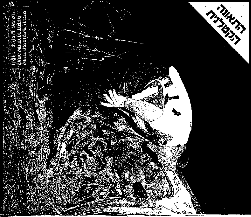
עזיקו המיוזביש הודיזם לזאח שהודודו לזמנע וזערת אלזמנים: אפי שרר